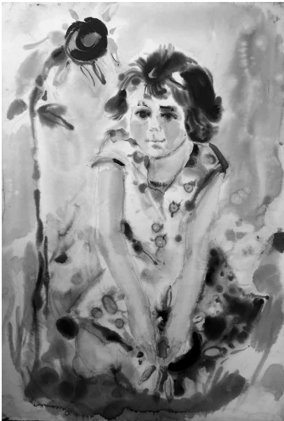
Vida NORKUTĖ. Mergaitė su saulėgraža . 1974. Akvarelė, 60 × 40