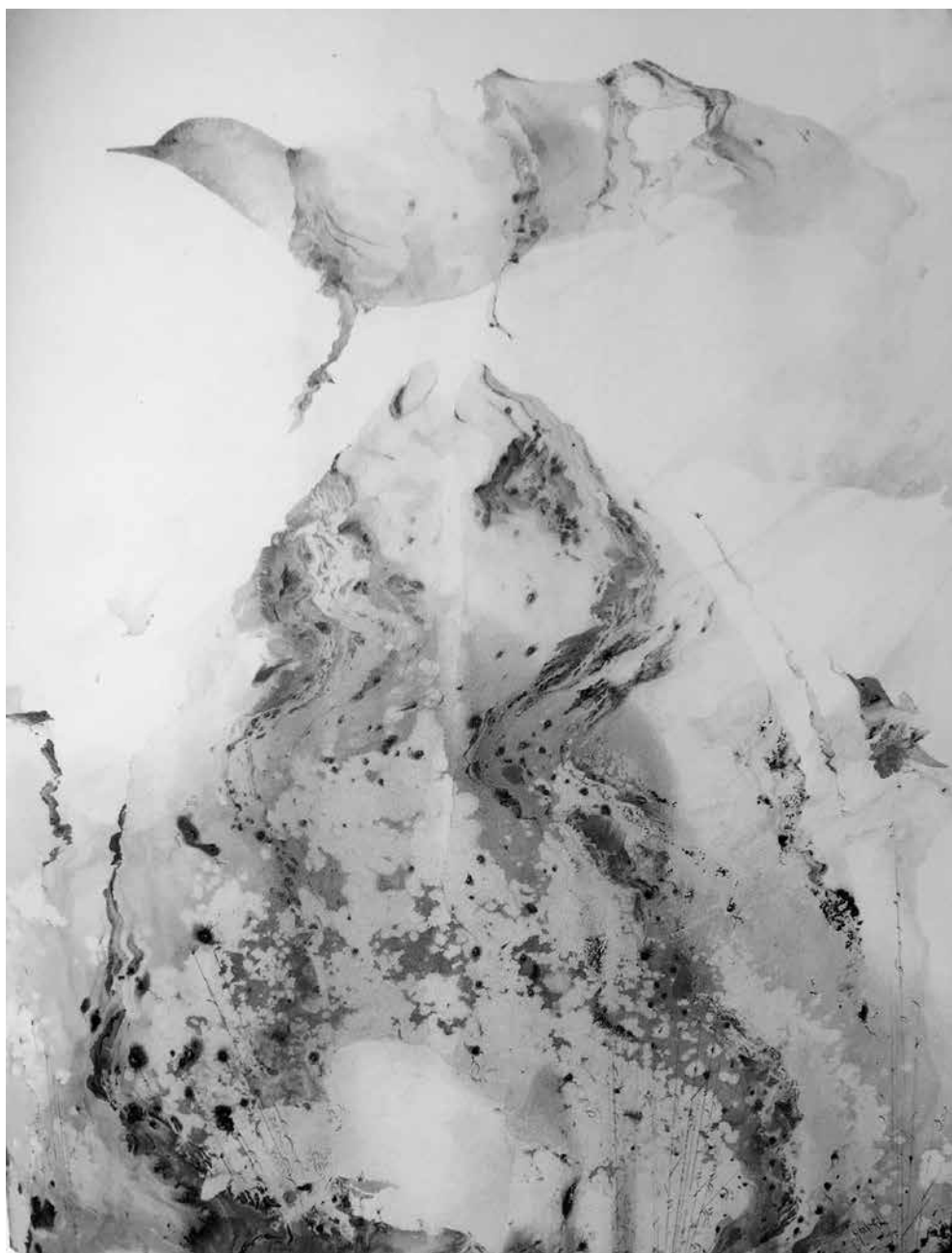
Vida NORKUTĖ. Tegu sugrįžta žodžiai . 2008. 70 × 60