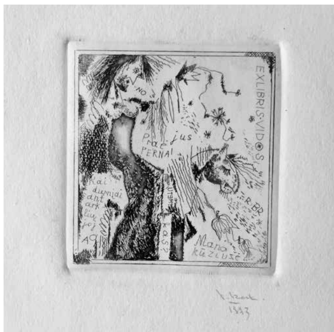
Vida NORKUTĖ. EX LIBRIS, Vidos . 1977. Ofortas, 6 × 6