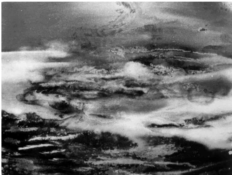
Vida NORKUTĖ. Jūros krantas . 1999. 39 × 39