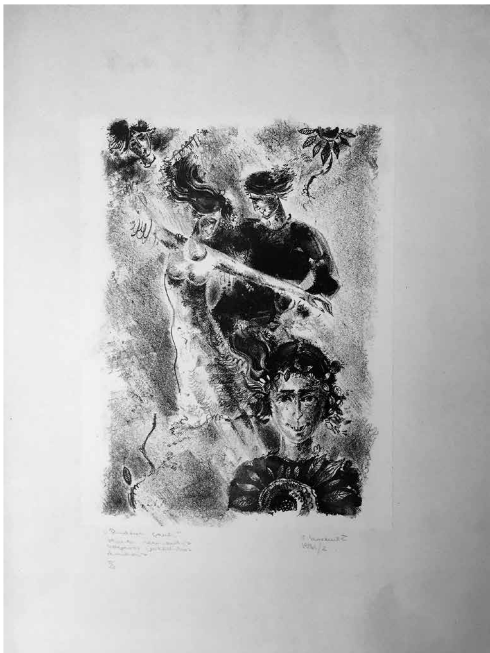
Vida NORKUTĖ. Rudens saulė . 1971. Ofortas, 22 × 16