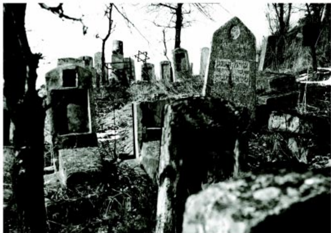
Rimantas Dichavičius. Vilniaus buvusios senosios žydų kapinės Olandų gatvėje 1963 m.