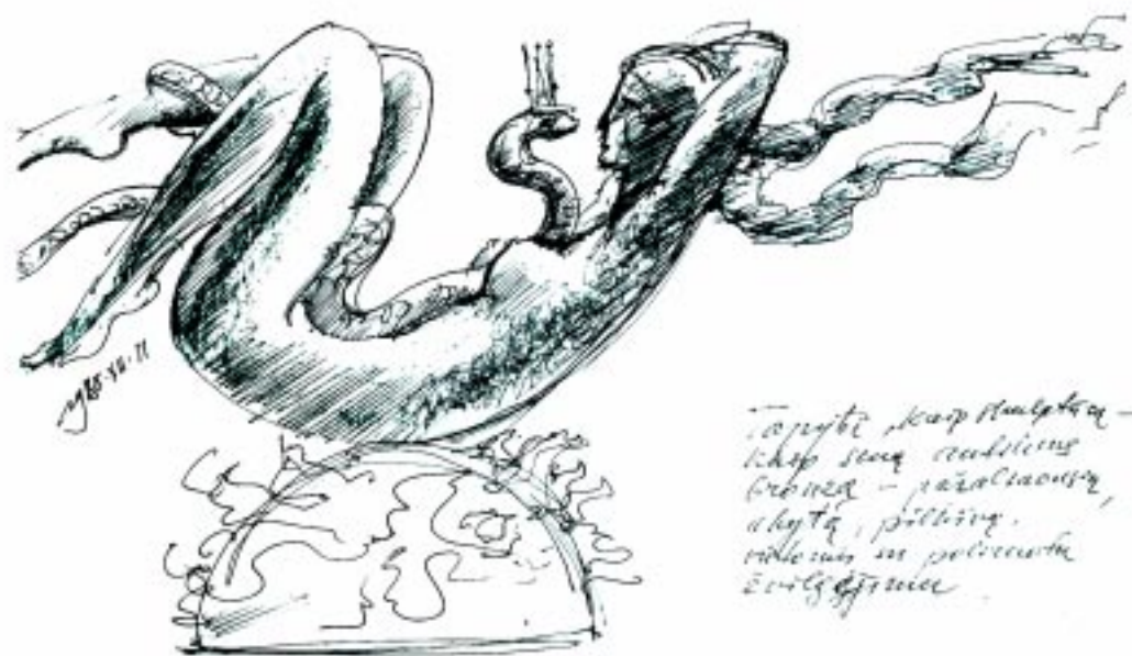
Rimantas Dichavičius. Piešiniai "Eglė žalčių karalienė" motyvais