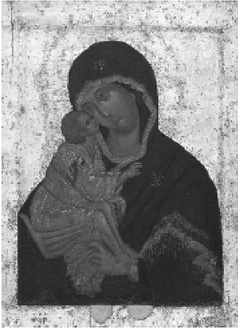
Teofanas Graikas. Dono Dievo Motina . 86 × 68