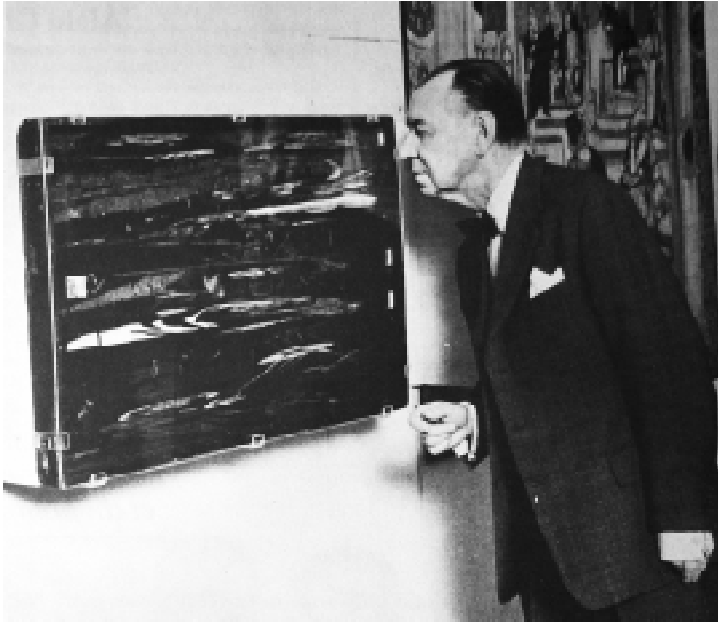
7. Paroda Anamorfozės (1975). „Aš mėgstu ydas, paremtas intelektu“ (Baltrušaitis)

Jęs menotyrininkas meno ir idėjų istoriją papildė novatoriškais ir originaliais metodais, tačiau, Louisui Grodeckiui perėmus Focillono postą Sorbonoje, o André Chasteliui išitvirtinus Collège de France , iš aktyvaus akademinio gyvenimo jis buvo savitai išstumtas. Gebėjęs išvelgti tamsiąsias įvairių reiškinių puses, Baltrušaitis matė ir tamsiuosius akademinės visuomenės užkaborius, todėl atsidėjo vien mokslinei ir kūrybinei veiklai. Viename interviu jis net buvo paklaustas, ar nėra taip, kad jis yra tam tikra aberacija, turint galvoje universitetinį klasikinį kelią, kurio jis nenuėjo? Ar nėra jis vienas iš tokių objektų, kuriuos jis tyrinėjo? Baltrušaitis atsakė, kad jis nesiekė sukurti mokyklos, ir tai jam suteikė daugiau laisvės bei įrankių.