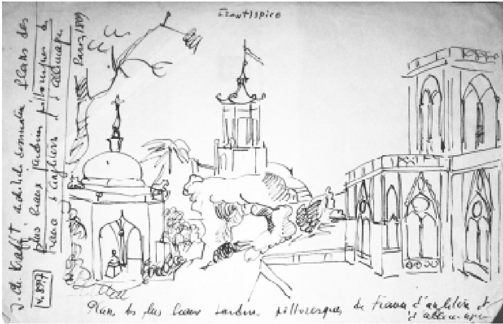
5. Baltrušaičio piešinys iš knygos Aeracijos rankraščio

torijos – tyrinėjamos formų atsiradimus, atgimimus, persikėlimus, transformacijų žaismus – savastimi.