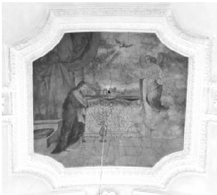
2 il. Jonas Kerle. Aprėiškimas Švč. Mergelei Marijai . 1898. Klijų tapyba. Kauno Šv. Kryžiaus baėnyėios navos skliautas. R. Valinėiūtės nuotr. 2005.

kiek pakilęs nuo žemės. Kompozicijos viršuje Šventosios Dvasios balandis, apgaubtas gelsvos šviesos, siuncia spindulių pluoštą link Marijos.