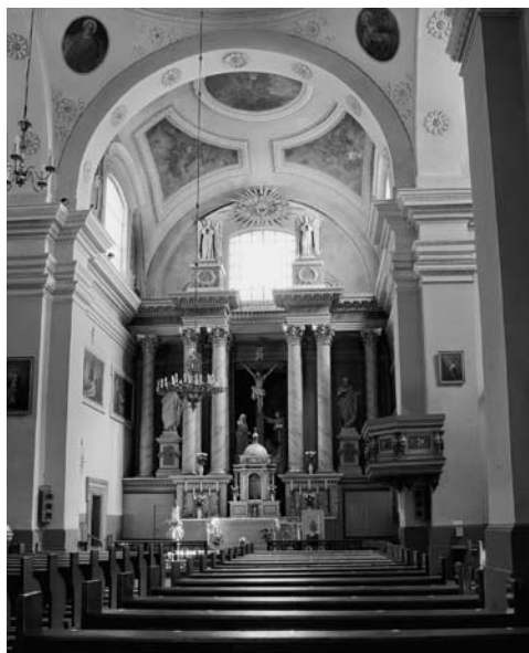
Šventojo Kryžiaus bažnyčios vidus. Vaizdas į presbiteriją. 2006 m.