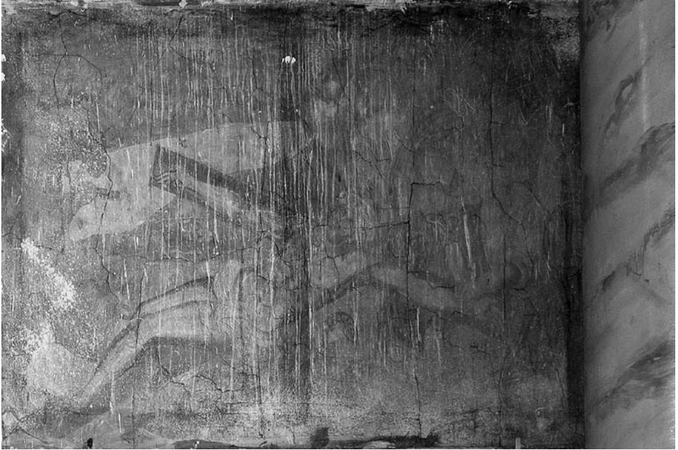
Jėzus prikalamas prie kryžiaus. XVII a. pab. freska. Šventojo Kryžiaus bažnyčia, Kaunas.

galva, iškylanti virš kryžmos. Kristus čia nutapytas dar gyvas; rodos, girdi jį meldžiantis: Tėve, atleisk jiems, nes jie nežino ką darą (Lk 23, 34).