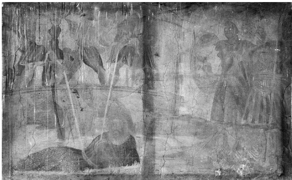
Viešpats Jėzus, į Kedrono upelį nuo tiltuko nustumtas. XVII a. pab. freska. Šventojo Kryžiaus bažnyčia, Kaunas.

kiek laisvės turėjo dailininkas juos interpretuojant. Kita vertus, visuose išlikusiuose paveiksluose ilgaplaukio ir barzdoto stovinčio Jėzaus figūra beveik visada vaizduojama pačiame centre.