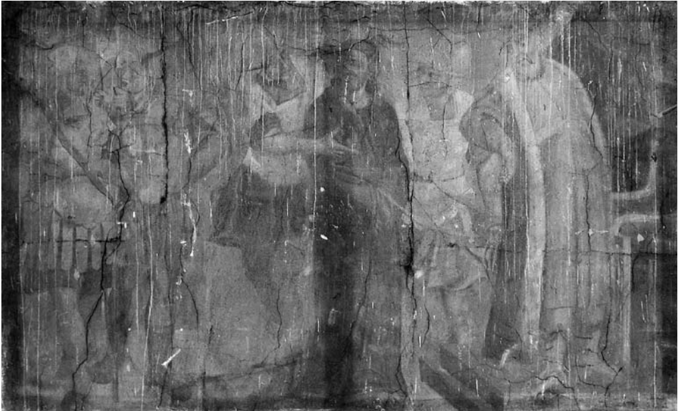
Pas Pilotą. XVII a. pab. freska. Šventojo Kryžiaus bažnyčia, Kaunas.

pavaizduoti ypatingame santykiyje: dešinėje pusėje nuo ant dviejų pakopų pakylęs Pilotas žiūri į Jėzaus pusę, tačiau ir Žmogaus Sūnus žvelgia ta pačia kryptimi. Priešingoje pusėje stoviniuoja mažiausiai trys ginkluoti romėnų kariai, demonstruodami savo galią. O Jėzus, iš abiejų pusių saugomas romėnų kareivių, ir čia išlieka kompozicijos centre. Dėl įvykių gausos šiame siužete galimos įvairios freskos interpretacijos išryškinant vieną ar kitą momentą. Tačiau šioje freskoje, viena vertus, akivaizdžiai parodoma Piloto bejėgystė iš baimės stengiantis Žmogaus Sūnų paleisti, kita vertus, ryžtingas Jėzaus nusisukimas nuo Piloto liudija Jo tvirtą nusiteikimą vykdyti Dievo valią iki galo.