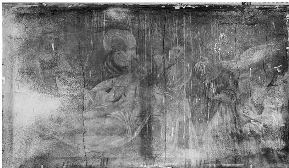
Guldymas į kapą . XVII a. pab. freska. Šventojo Kryžiaus bažnyčia, Kaunas.

veik neįmanoma išskirti Juozapo iš Arimatėjos, tačiau likusios figūros atpažįstamos lengviau: pirmame plane irgi įstrižai (šiuokart horizontalia kryptimi) nutapyta kenčianti Dievo Motina; atsirėmusi į ją iš už nugaros abiem rankom apkabinusią Mariją Magdalię, ji savo laikysena liudija begalinį skausmą. 22 Visos pavaizduotos figūros sutelktos dešinėje pusėje; jų išdėstymas pagal minėtąsias įstrižaines kompozicijai suteikia dinamiskumo. Pačiame freskos krašte profiliu nutapyta kulisinė figūra tikriausiai vaizduoja mylimąjį Jėzaus mokinį Joną.