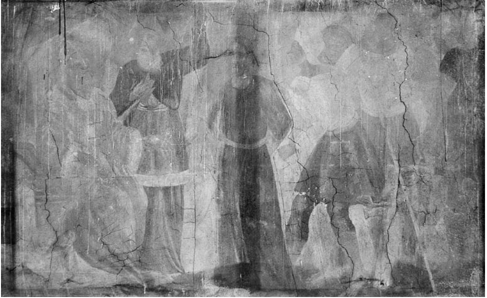
Pas Kajafą. XVII a. pab. freska. Šventojo Kryžiaus bažnyčia, Kaunas.

aniems įsakinėja. Jie stebi upelin įstumtą Jėzų, o Viešpats, matomas tik iki krūtinės, pasisukęs tiesiai į žiūrovą, t.y. į mus, žvelgia kupinomis gailėsčio akimis čia ir dabar. Balkšva virvė ties Jėzaus juosmeniu ir abu jos galai kareivių rankose sudaro raiškų lygiašonį trikampį. Ir šioje freskoje išryškintas kontrastas: „šurmulys“ ant tiltuko ir liūdesio nuspalvinta ramybė Jėzaus veide. Šią sceną abejingai stebi upelio pakrantėje stovintys du ginkluoti kareiviai: vienas jų laiko skydą, kitas – ilgą ietį; ši kulininė figūra užsklendžia kompoziciją.