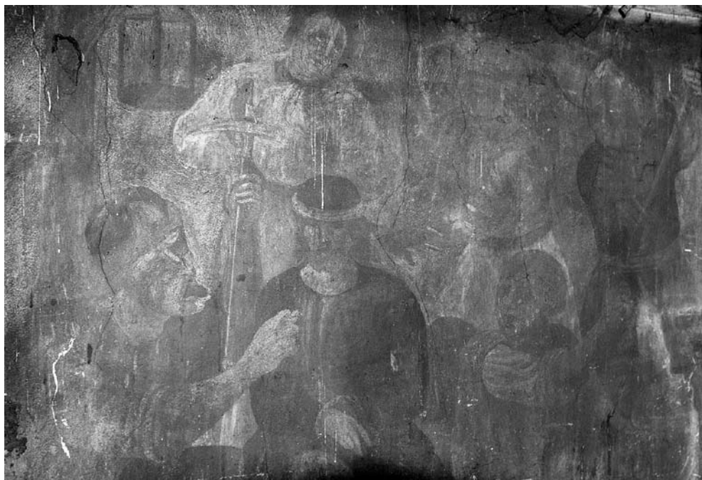
Patyčios . XVII a. pab. freska. Šventojo Kryžiaus bažnyčia, Kaunas.

griausmingu balsu „šaukia“ kaltindamas Jėzų piktžodžiuimu. Ir čia Jėzus nutapytas paveikslo centre, tik jo rankos surištos ne priekyje, o už nugaros. Tarsi girdi Jo atsakymą: Taip yra, kaip sakote: Aš Esu! (Lk 22, 70). Už Žmogaus Sūnaus pavaizduotos trys „judančios“ kareivių figūros, sukeliančios minios įspūdį.