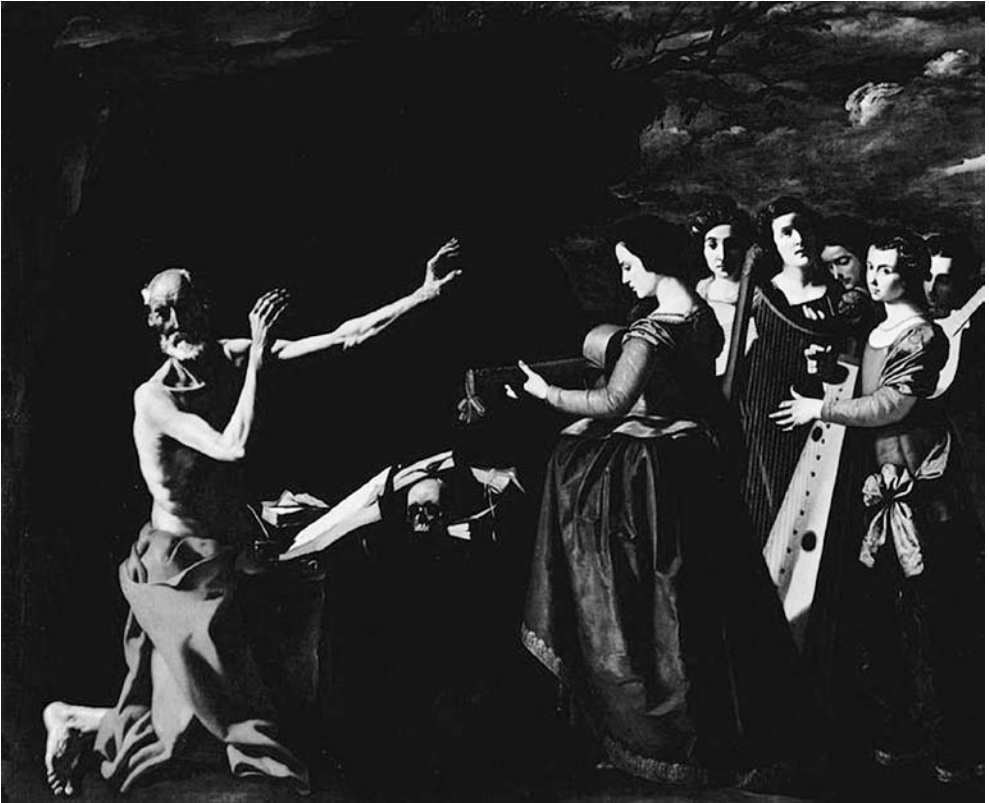
Francisco de Zurbarán (1598–1664). Šv. Jeronimas, tyruose kankinamas prisiminimų (gr. λογίσμοι) apie šokančias Romos merginas 4 .

į Šventąjį Kalną“ – galimas šaltinis „fenomenologinių meditacijų“, taip pat tikrinančių, ant ko būtų galima „stovėti tvirtai“ (Gal 5, 1), pasaulį apžvelgti panoramiškai. Kalbant karteziškai, šios religinės tradicijos puoselėtojas irgi ieško to, kieno bent jau buvimu, veikimu jokia racionali būtybė daugiau nepajėgtų abejoti, kieno buvimu ir veikimu visiškai akivaizdumas, tikrumas (lot. certitudo ), patiriamas mistinėje teofanijos dovanoje (o fenomenologui – transcendentinėje savimonėje), nekeltų jokios dvejonės. Nebent jis pats, nors ir ištiktas dvasioje Dievo tikrovės akivaizdumo patirties, sąmoningai nenorėtų ant taip