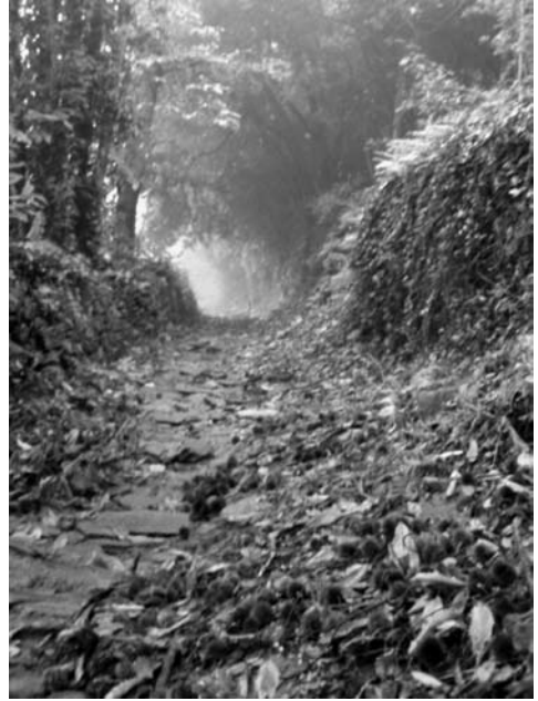
Kelias į šv. Kutlumušo vienuolyną (gr. Μονή Κουτλουμουσίου). 2007 m. lapkritis, Šv. Atono Kalnas.

Suprantama, Dykumų anachoretų ar šiuolaikinių jų dvasinės kelionės bendrakeleivių isichastų dvasinio tobulėjimo pakopomis neįmanoma kilti nei neturint tyrų širdies intencijų, nei nevadovaujant „iš šalies“ Dievo Malonei. Tačiau kyla klausimas: ar esama fenomenologinio – beprielaidinio – šios srities, t. y. sinergetinės asmens sąveikos su taip geidžiamu pradmeniu – aukščiausiuoju tikrovės principu – dieviškuoju ἀρχή (kitaip nei