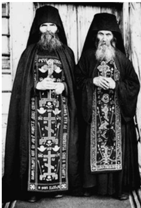
Šv. Atono Kalno asketai (XX a. pradžia) 13

atmetami pakaitalai, klaidingi vaizdiniai: dykumoje „nėra vietos užgaidoms, viskas yra visumos dalis“ 14 .