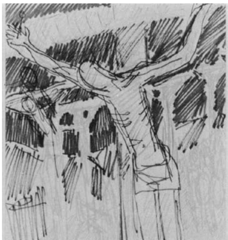
Augustinas SAVICKAS. Eskizas paveikslų ciklui „Kova“. XI. Spartakas . 1969. Popierius, spalvotas flomasteris. 9 × 13