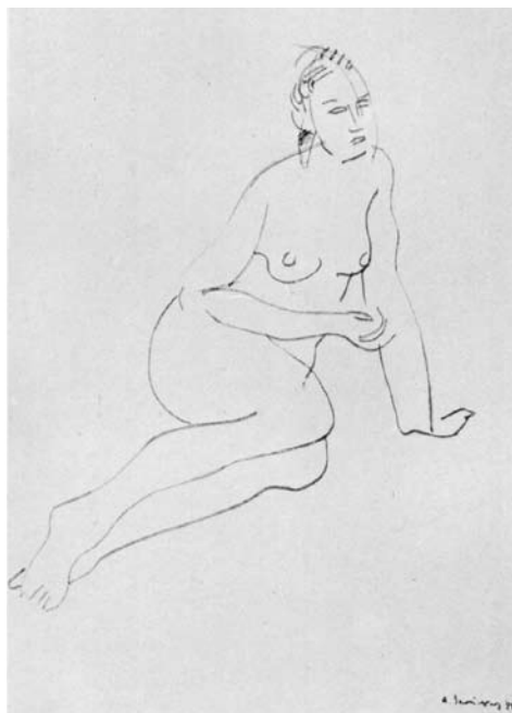
Augustinas SAVICKAS. Moters akto eskizas. I. 1981. Popierius, flomasteris. 63,5 x 49