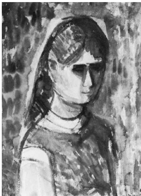
Augustinas SAVICKAS. Duktės portretas . 1968. Popierius, akvarelė. 76 × 56