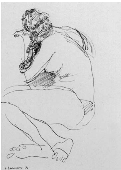
Augustinas SAVICKAS. Sėdinti. II. 1981. Popierius, tušas. 29,5 x 19,5