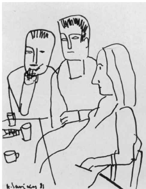
Augustinas SAVICKAS. Ligoniai ir seselė . 1981. Popierius, rudas flomasteris. 42 × 30