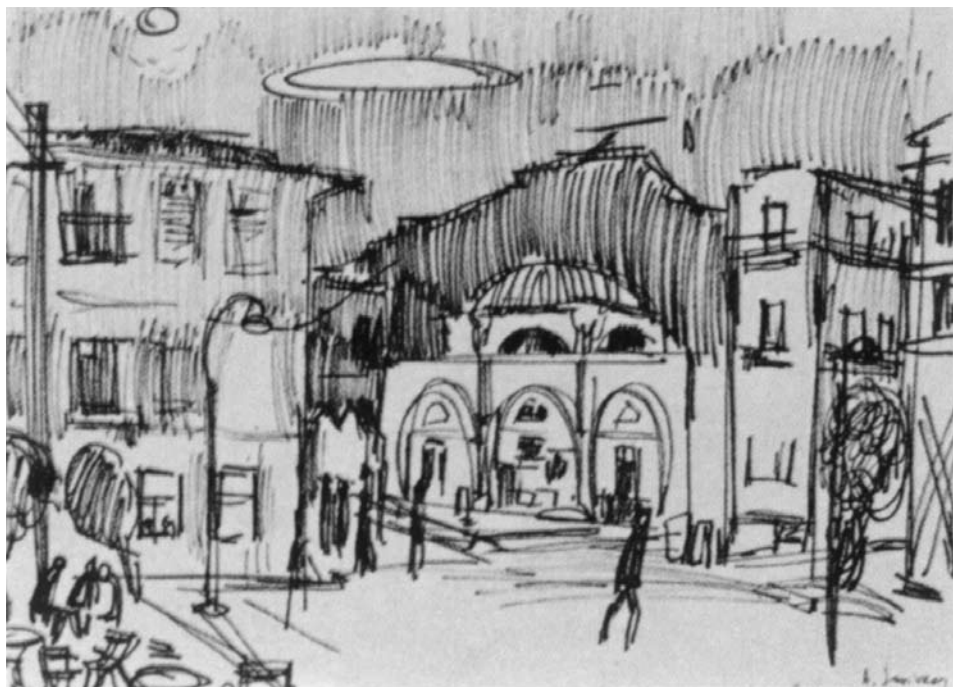
Augustinas SAVICKAS. Graikija. Nauplija naktį . 1963. Popierius, flomasteris. 50 × 60