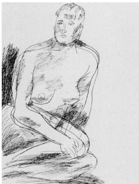
Augustinas SAVICKAS. Moteris su nuleista ranka . 1981. Popierius, tušas. 30 × 20