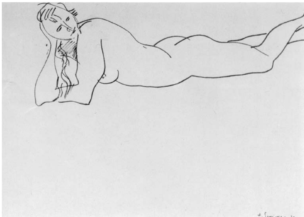
Augustinas SAVICKAS. Gulinti moteris . 1981. Popierius, flomasteris. 49 × 63,5