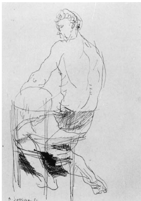
Augustinas SAVICKAS. Atletas iš nugaros. 1983. Popierius, tušas. 42,5 x 30