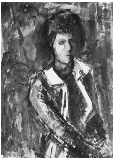
Augustinas SAVICKAS. Žmonos portretas . 1968. Popierius, akvarelė. 76 × 56