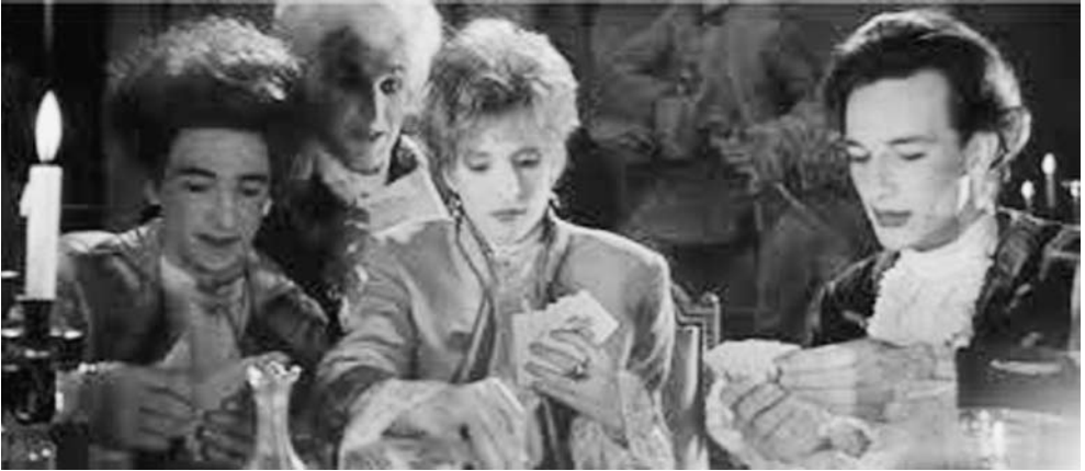
Kortavimas – populiariausias Lietuvos saloninės kultūros atributas