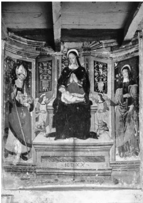
12 il. Nežinomas vietinis dailininkas. Madona su Kūdikiu, šv. Benediktu ir šv. Skolastika . 1520 m. Freska. Nursijos šv. Jono bažnyčia, Italija.