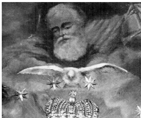
6 il. Nerestauruoto paveikslo Šventieji Benediktas ir Skolastika, garbinantys Švč. Mergelę Mariją detalė. Dievas Tėvas ir Šv. Dvasia. Kražių Švč. Mergelės Marijos Nekaltojo Prasidėjimo bažnyčia.