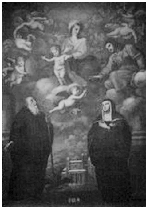
13 il. Carlo Rosa. Madona su Kūdikiu, šv. Benediktu ir šv. Skolastika . 1640–1660 m. Drobė, aliejus. 301 × 204. Puglia, Italija.

pasirinkimas savotiškai atspindi visumos vaizdą, todėl galime matyti, kad Kražių paveiksle esantis derinys lietuviškoje benediktiniškoje tradicijoje yra pakankamai savitas. Tokio derinio, kai būtų susiejami šventųjų dvynių ir Švč. M. Marijos ikonografiniai siužetai, Lietuvoje nepasitaikė aptikti.