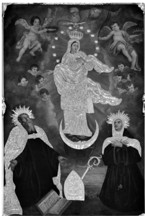
1 il. Nežinomas autorius. Šventieji Benediktas ir Skolastika, garbinantys Švč. Mergelę Mariją su aptaisais. XVII a. 5 deš. Aptaisai apie 1793 m. Drobė, aliejus. 325 × 240. Kražių Švč. Mergelės Marijos Nekaltojo Prasidėjimo bažnyčia.