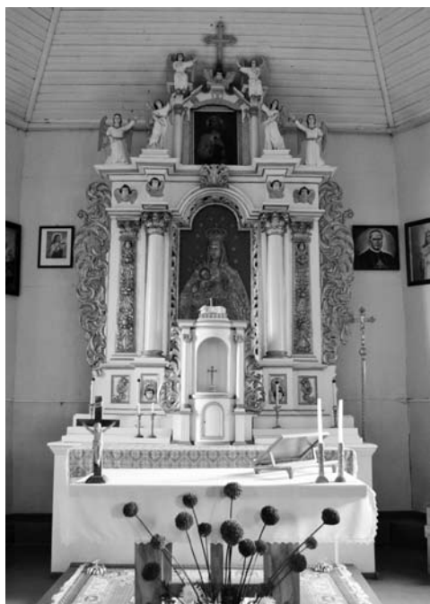
4 il. Nežinomas autorius. Maironių Švč. M. Marijos bažnyčios didysis altorius. XVII a. II p. Medis, drožyba.