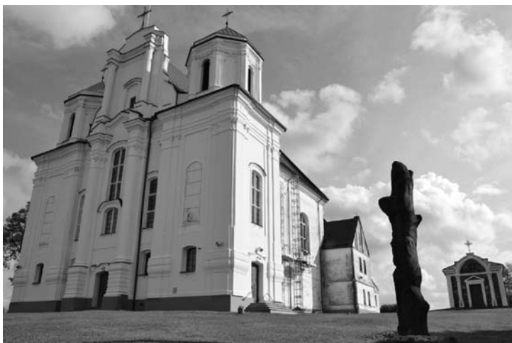
2 il. Tomas Žebrauskas. Kražių Švč. M. Marijos Nekaltojo Prasidėjimo bažny-čia. 1762 m.

Į naujosios bažnyčios erdvę buvo per-kelta dalis senojo inventoriaus. Tarp per-keltų daiktų buvo anksčiau minėtas di-džiajame altoriuje kabėjęs Trakų Dievo