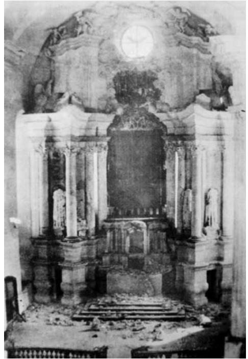
5 il. Kražių bažnyčios didysis altorius po „Kražių skerdynių“. XIX a. pab. nuotrauka.

Taigi ją perėmęs tuometinis klebonas kun. Jonas Talmanas ėmėsi nuniokotos bažnyčios restauravimo darbų, trukusių iki 1910 m., kada bažnyčia buvo konsekruota. Tuomet buvo surašytas inventoriųs.