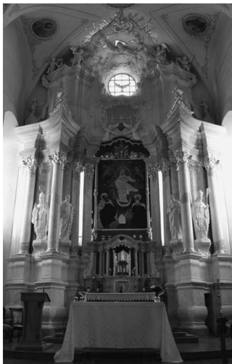
9 il. Nežinomas autorius. Kražių Švč. M. Marijos Nekaltojo Prasidėjimo bažnyčios didysis altorius. XVIII a. 7 deš. Mūras, dirbtinis marmuras, stiuakas, auksavimas.

riomis kompozicinio orderio kolonomis, po dvi abipus retabulo, remiančiomis itin grakštų, dinamiškų formų, tarsi užlenktą į viršų antablementą. Centrinėje įgilintoje dalyje komponuojamas gana savarankiškai funkcionuojantis sumažintų proporcijų, bet su altoriumi stilistiškai susietas tabernakulis. Virš jo kabo paveikslas. Antro tarpsnio plokštuma prigludusi prie sienos. Šis tarpsnis, panašiai kaip pirmasis, suskaidytas į tris vertikalias dalis. Iš kraštų įkomponuotus dekoratyvius piliastrus vainikuoja banguojantys karnizai. Antro tarpsnio vidurinėje dalyje aplink apvalų langą iš stiuoko suformuota minkštų, apvalių debesų gloriija.