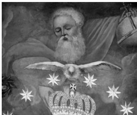
7 il. Paveikslo Šventieji Benediktas ir Skolastika, garbinantys Švč. Mergelę Mariją detalė. Dievas Tėvas ir Šv. Dvasia. Kražių Švč. Mergelės Marijos Nekaltojo Prasidėjimo bažnyčia.

butų įterpimas į Mariją gaubiančią tapytą spindulių mandorlą suartino su moterį „apsiautusia“ saule, o tai jau liudija naujo ikonografijos „sluoksniu“ atsiradimą. Ne tokį harmoningą ir kur kas komplikutesnę pokytį lėmė kartu su aptaisais pritaisyta auksuota karūna. Taip tarsį naujai pratęstas Ėmimo į dangų ikonografijos tipas, tačiau paveiksle likusi tapyta karūna, laikoma angelo, gerokai supainioja ikonografiją. Be to, paveiksle su aptaisais atrodytų, kad Dievas Tėvas dešine ranka deda Švč. Mergelei Marijai ant galvos aptaisuose įkomponuotą karūną, tačiau per paskutinį restauravimą kilo abejonių, ar ši detalė tikrai priklausė originalui.