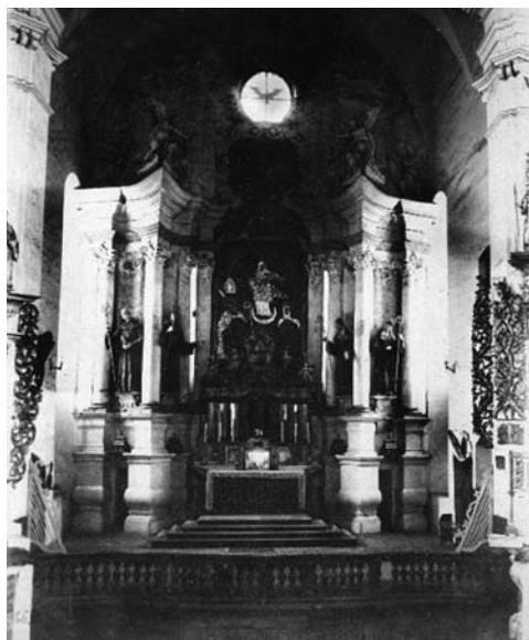
3 il. Kražių Švč. M. Marijos Nekaltojo Prasidėjimo bažnyčios didysis altorius prieš Kražių skerdynes. Apie 1893 m.