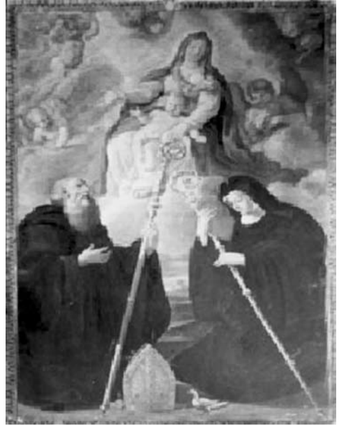
14 il. Nežinomas centrinės Italijos dailininkas. Madona su Kūdikiu, šv. Benediktu ir šv. Skolastika. 1700–1749 m. Drobė, aliejus. 230 × 150. Umbrija, Italija.