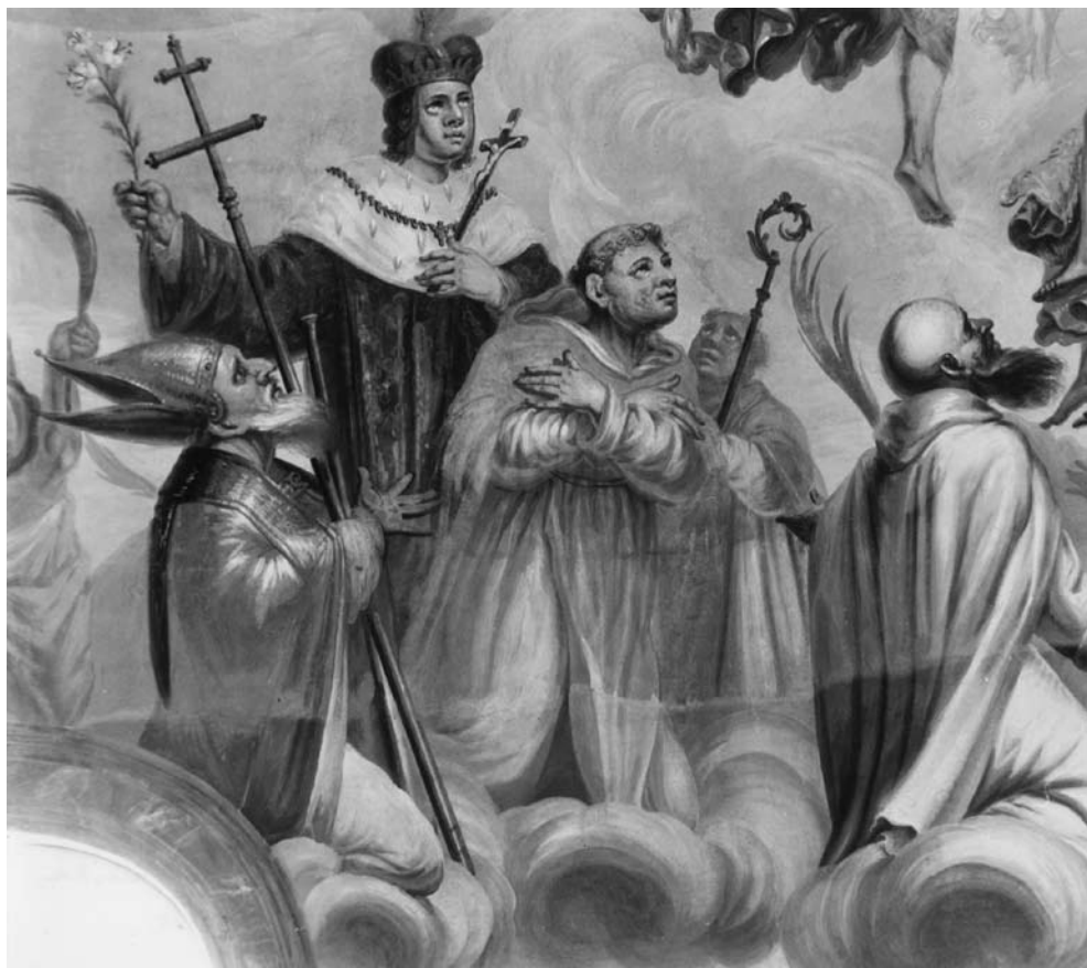
8 il. Šventųjų Adalberto Vaitiekaus, Brunono Kverfurtiečio ir Kazimiero grupė. Šventųjų rato fragmentas. 1988 m.

cifiksą. Kiek tolėliau – apnuoginto šv. Sebastijono su į kūną įsmigusia strėle figūra ir, be abejo, išpūdingai nutapytas didžiule lazda pasirėmęs šv. Kristupas su vaikiu Jėzumi ant rankos. Pirmame plane, priešais Kristupą, matome klūpantį jėzuitų vienuolį šv. Ignacą Lojolą (1491–1556) 15 . Tai tamsaus ispaniško gymio, pliktelėjęs, trumpa tamsia barzda vyriškis; jį atpažįstame ir iš drabužių: apsiautęs kapa, vilkintis nėriniais dabinatą kamžą, užsidėjęs puošnią siuvinėtą stulą. Šv. Ignaco Lojolos su bendražygiais įkurta Jėzaus draugija ( Societas Jesu )