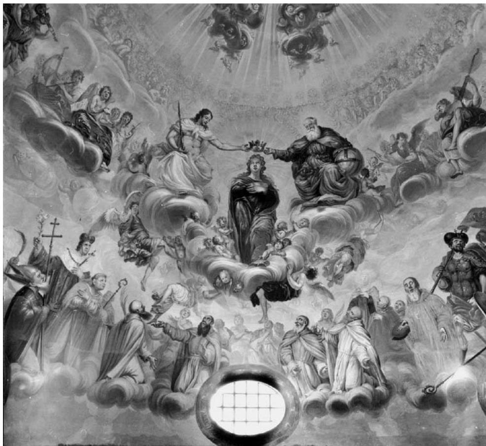
6 il. Švč. Mergelės Marijos vainikavimas danguje serafimų, cherubinių, muzikuojančių angelų ir šventųjų apsuptyje. Kupolo freska. 1988 m.

ir pasauliečius. Tiesiai po Marijos figūra (6 il.), už ovalinio lango, kiek giliau nutapyta keturių neatpažintų moterų grupė, o abipus ovalinio lango matome po du kamaldulių vienuolius, vilkinčius baltus abitus. Veikiausiai dešinėje klūpantis praplikęs vyriškis aukšta kakta – tai šv. Romualdas, žvelgiantis į dangų (abato figūra nutapyta beveik tiesiog po Dievo Tėvo atvaizdu). Tuoj už jo, manychiau, neklystu, šv. Benediktu vadindama priklaupusį, į dangų žvelgiantį raiškių broožų žilabarzdį vienuolį, vilkintį švie-