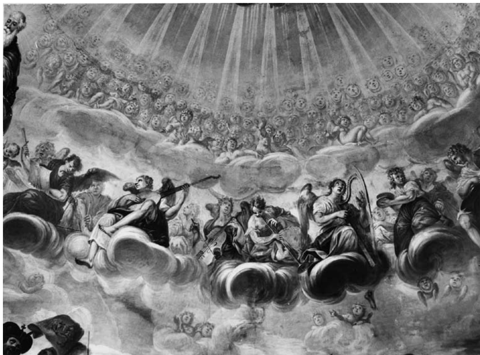
5 il. Muzikuojančiųjų angelų rato fragmentas. 1988 m.

Abipus Dievo Tėvo ir Sūnaus vainikuojamos Marijos pavaizduotas gausus būrys angelų muzikuoja įvairiausiai instrumentais. Sėdintys ant kamuolinių debesų angelai nutapyti erdviniame fone, dauguma jų pavaizduoti visa figūra ir jaunuoliško amžiaus. Dinamiškais ir įvairiais rakursais, muzikaliu judesiu angelai