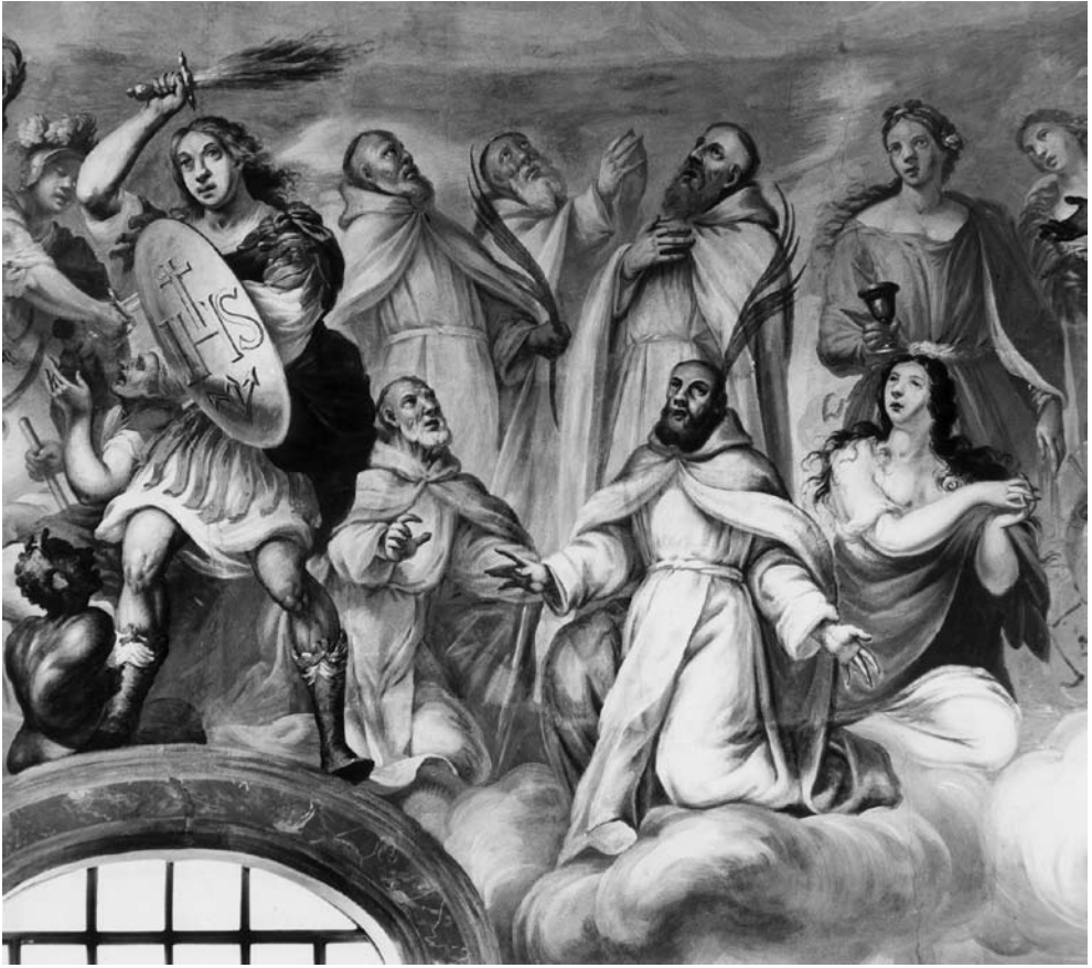
9 il. Šv. Mykolas arkangelas ir penki benediktinų kankiniai. Šventųjų rato fragmentas. 1988 m.

pirmame plane, ant kamuolinių debesų, prie ovalaus lango nutapyti trys išminčiai, kadaise atkeliavę į Betliejų pagarbinti gimusio Kūdikiu Jėzaus. Šioje vientsoje trijų asmenų grupėje kairiau, pirmame plane, ekspresyviai nutapytos sėdinčių karūnuoto Kasparo, laikancio indą su simboline dovana – auksu, ir Merkelio figūros, už jų – kompoziciją užbaigianti monumentalio stovinčio jauno juodaodžio Baltazaro figūra.