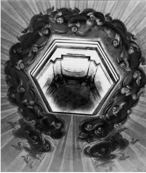
2 il. Apie šešiakampio žibinto pagrindą pasklidę serafimai prasiskleidžia į dvi puses virš Marijos galvos.

templiuodami Dievą, angelai Jį šlovina, Jam tarnauja, yra Jo pasiuntiniai, vykdančios žmonių išganyimo misiją. 48 Teigiama, kad Dievas sukūrė angelus savo ir žmonių tarnystei ir jie yra aukščiausi tarp visų Dievo kūrinijų. Šioms bekūnėms dvasioms taip pat būdingas hierarchinis ir funkcinis pasiskirstymas. Aukščiausios hierarchinės eilės angelai, t. y. serafimai, cherubiniai ir sosto angelai, pasižymi ypač stipria ir galinga meile Dievui ir ją išreiškia šlovindami bei garbindami Viešpatį supdami Jo sostą. Todėl aukščiausiųjų chorų angelai beveik niekada nevaizduojami vieni, nes tik supdami Dievo sostą jie įgauna ypatingą buvimo prasmę. Šv. Tomas Akviniėtis teigė, kad angelai yra grynas protas ir neturi kūno 9 . Kadangi protas yra galvoje, viduramžiais pirmuosius du chorus, serafimus ir cherubinus, imta vaizduoti be kūno, vien tik galvutes su sparnais.