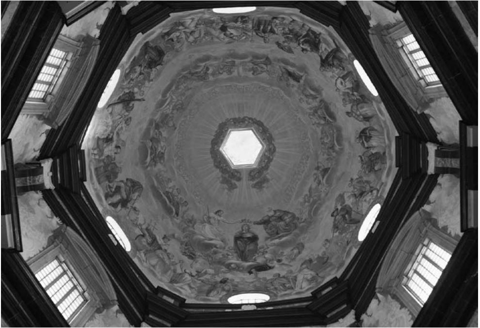
1 il. Rossi, Giuseppe. Švč. Mergelės Marijos vainikavimas. Freska. 1712–1719. Visuminis vaizdas į Pažaislio bažnyčios kupolo daugiafigūrę freską iš apačios. Fot. Aurimas Švedas. 2013 m.

disonuoja su visa Pažaislio vienuolyno daile. Kita vertus, dvylikos apaštalų paveikslai ortodoksų soboruose ir cerkvėse yra privalomi – matyt, dėl šios priežasties jie ir buvo nutapyti.