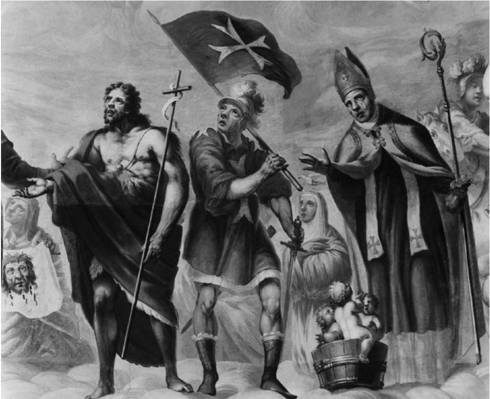
11 il. Šventosios Veronika ir Skolastika, šventieji Jonas Krikštytojas ir Mikalojus. Šventųjų rato fragmentas. 1988 m.

geriau matyti tik jo viršutinė figūros dalis. Raitelis vilki viduramžių riterio aprangą. Tad vis dėlto galima spėti, kad čia veikiausiai pavaizduotas šv. Jurgis, kovojantis su blogiu ir jį nugalintis. Už šio personažo nutapytas tris vaikelius iš mirusiųjų prikėlęs vyskupas šv. Mikalojaus (?–apie 345 arba 352) 16 . Nors ir trūksta jo gyvenimą patvirtinančių dokumentų, žinoma, kad jis vyskupavo Mažojoje Azijoje, buvo nominuotas Miro vyskupu. Jis yra keliautojų, jūreivių ir vaikų globėjas, laikytinas Kalėdų senelio prototipu (11 il.). Dailėje žinome kelis siužetus, dažniausiai susijusius su stebuklais. Pažaislio bažnyčios kupole pavaizduotas