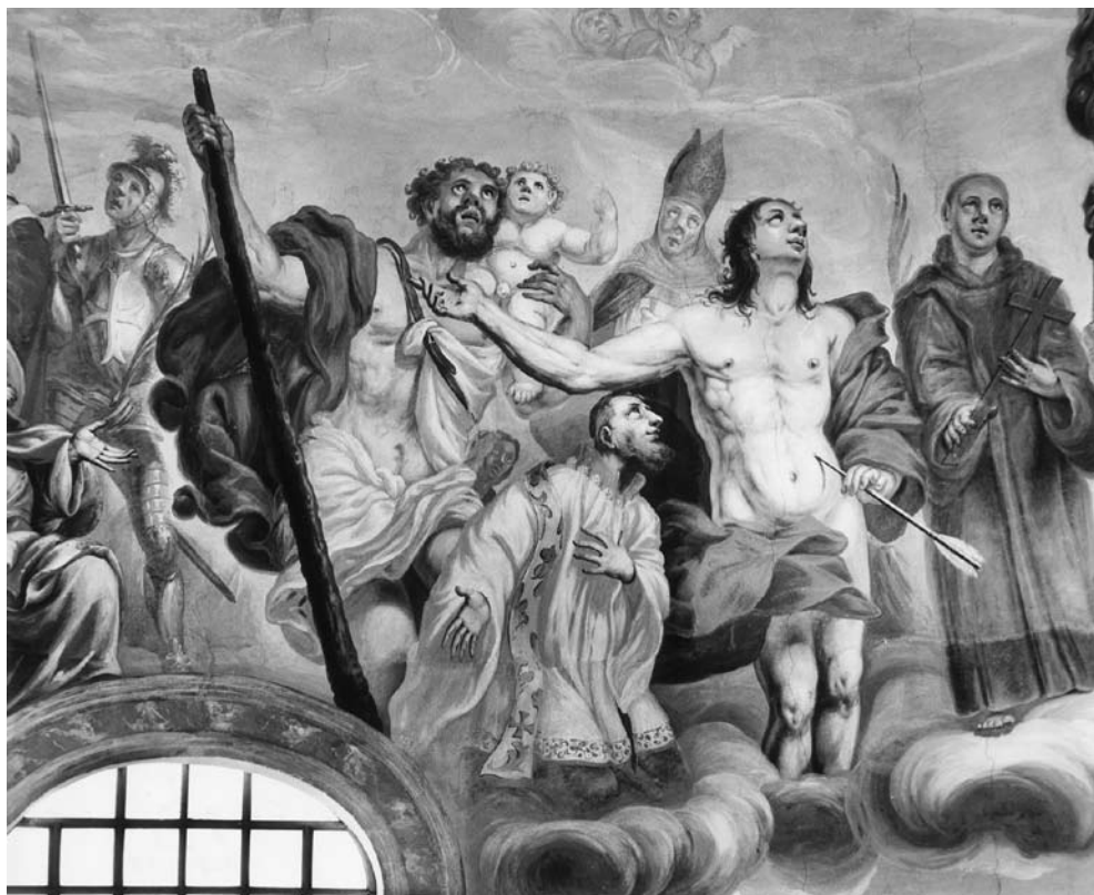
10 il. Šventieji Sebastijonas, Ignacas ir Kristupas su kūdikiu Jėzumi. Šventųjų rato fragmentas. 1988 m.

stovi: už šv. Kotrynos Aleksandrietės matome šv. Barborą su taure ir kiek toliau – šv. Uršulę su piligrimės lazda.