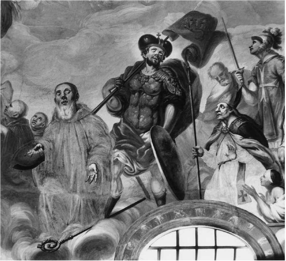
7 il. Šventųjų Benedikto, Čekijos kankinio Vaelovo ir Stanislovo, prikeliančio Piotrovina, grupė. Šventųjų rato fragmentas. 1988 m.

Priešingoje pusėje, po Jėzaus Kristaus atvaizdu, neatsitiktinai sugrupuotos trys figūros: viduryje – stovintis šv. Kazimieras su kunigaikščio kepure, vilkintis šermuonėlių mantiją, dešinėje iškeltoje rankoje laikantis lelijos šaką, kaire ranka prie krūtinės prispaudęs krucifiksą; arčiau ovalinio lango, pirmame plane, klūpo vyskupo drabužiais apsirendęs šv. Adalbertas Vaitiekus, išimenantis raiškiu profiliu, atpažįstamas iš arkivyskupo kryžiaus ir irklų; trečiasis balkšvu abitu vilkintis vienuolis – tai