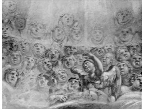
3 il. Džiūgaujantys cherubiniai. Kupolo freskos fragmentas. 1988 m.

Bekūnės dangiškosios dvasios su nuostaba džiaugiasi, gieda ir adoruoja tai, kas jų akivaizdoje vyksta. Žvelgiant iš apačios, cherubiniai tarsi pranyksta panirę į dangaus sosto debesis. Bet aukščiau ir arčiau Šventosios Dvasios šviesos esančių cherubinų galvutes žymi kontūrinės linijos. Taigi jie išlieka šviesoje. Visi aukščiausiųjų chorų angelai aktyviai dalyvauja dangaus misterijoje – Vainikavime, taip pirmiausia pritardami Marijos – angelų karalienės – titului (4 il.).