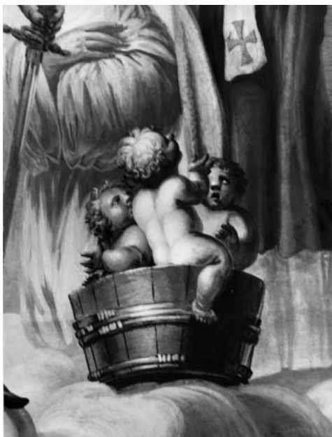
12 il. Fragmentas, kuriame matome tris nuogus vaikelius kubilėlyje, kuriuos šv. Mikalojaus prikėlė iš numirusių. 1988 m.

dvynių pokalbio, šv. Benediktas išvydo viziją, kurioje Skolastikos siela kilo į dangų kaip balandis 17 . Šalia, pirmame plane, pavaizduotas dar vienas neatpažintas riteris, viena ranka laikantis plevėsujančią vėliavą su Maltos ordino ženklų, kitoje – kalaviją.