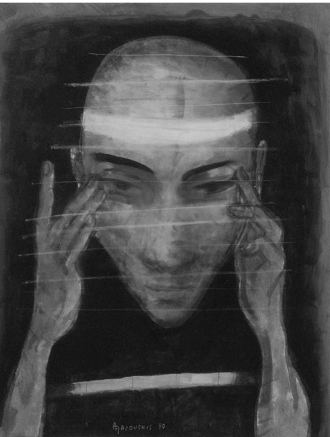
Adomas JACOVSKIS. Veidas-kaukė . 1990. Kartonas, aliejus. 90 × 70