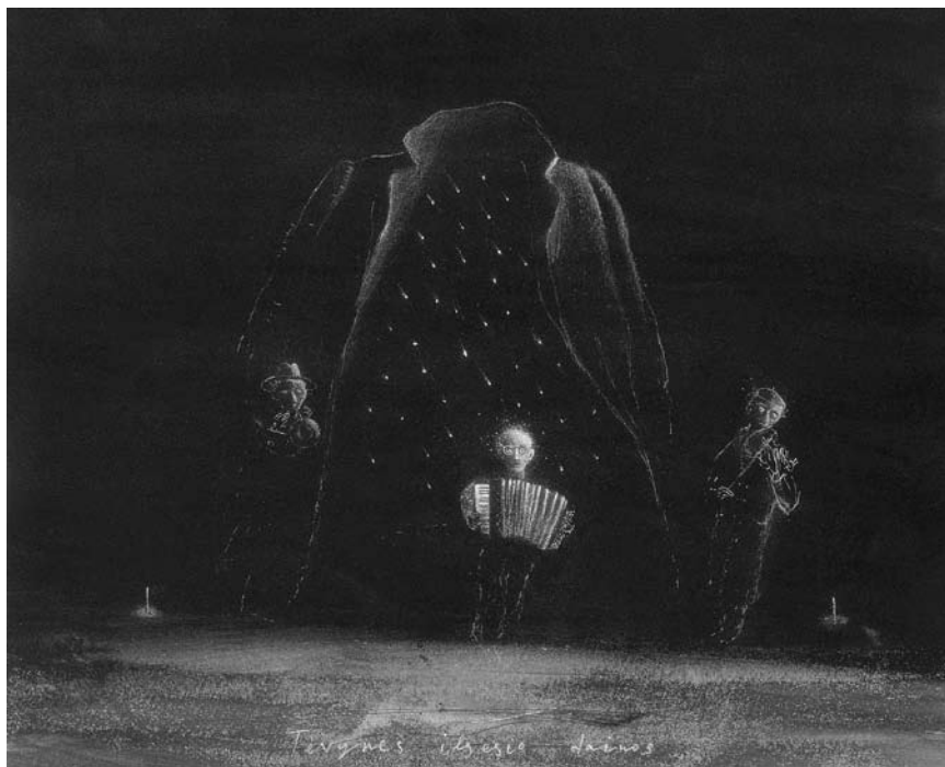
Adomas JACOVSKIS. Tėvynės ilgesio dainos . 1984. Popierius, tušas, pastelė. 40 × 50