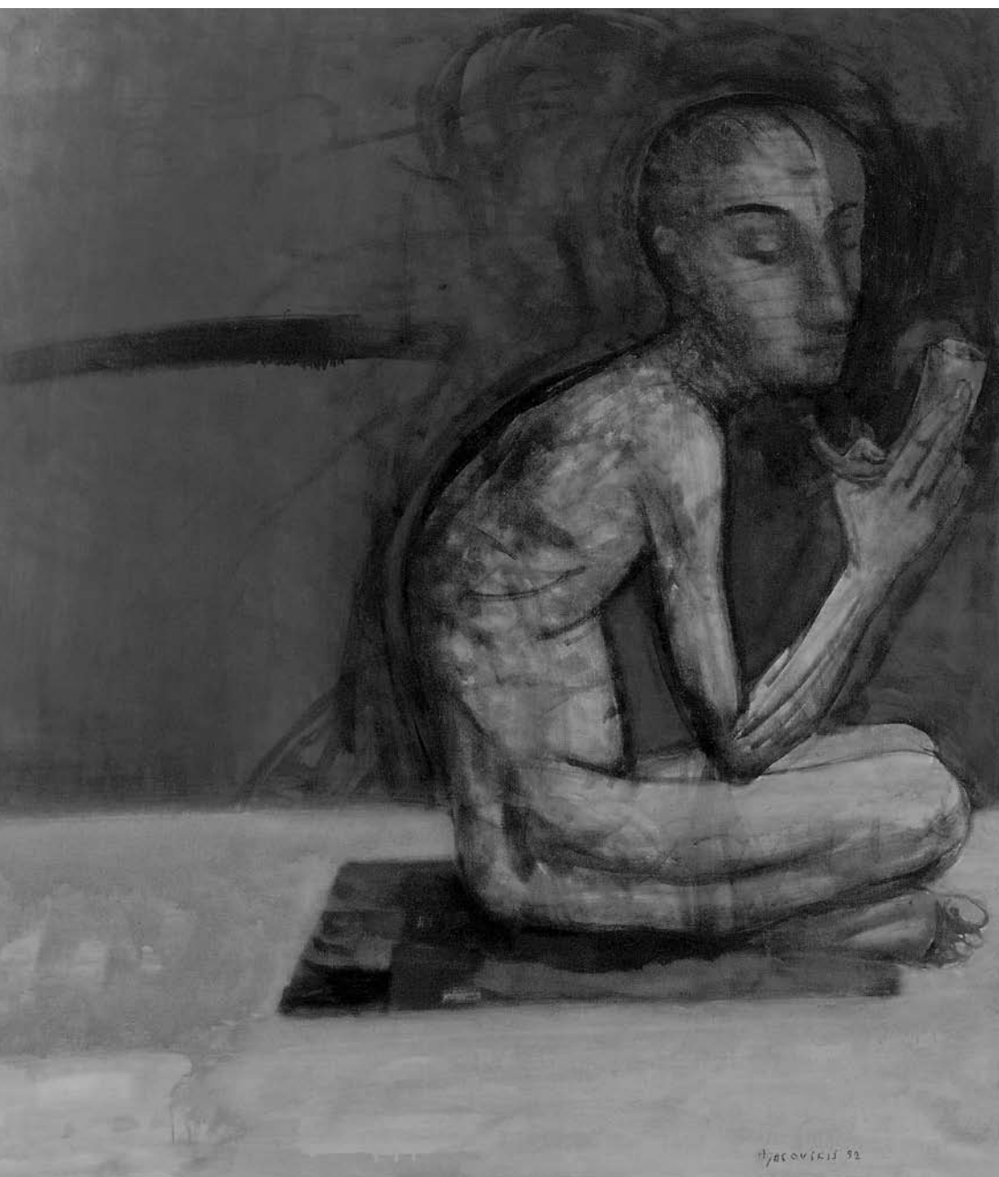
Adomas JACOVSKIS. Ciesmė . 1992. Drobė, aliejus. 150 × 130