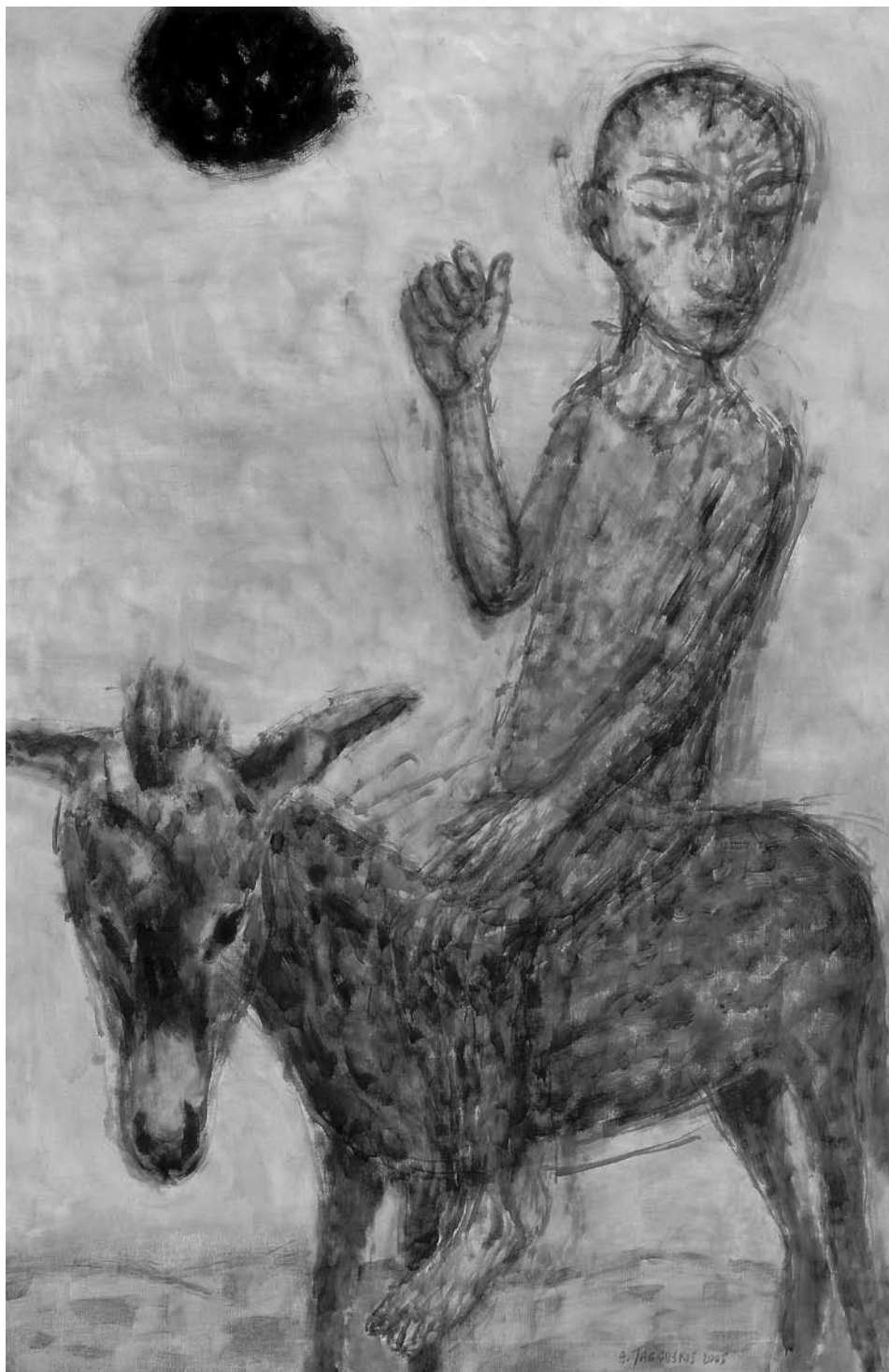
Adomas JACOVSKIS. Keliautojas. Orient. 2005. Drobė, aliejus. 200 × 130