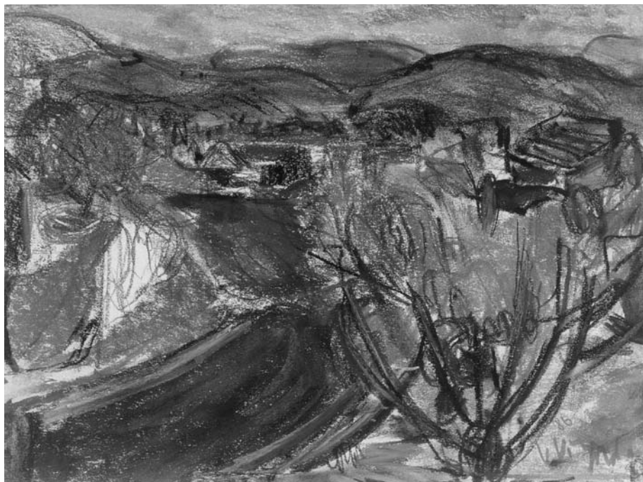
Viktoras VIZGIRDA. Glendale, Los Angeles . 1986. Popierius, pastelė. 30,4 × 40,3