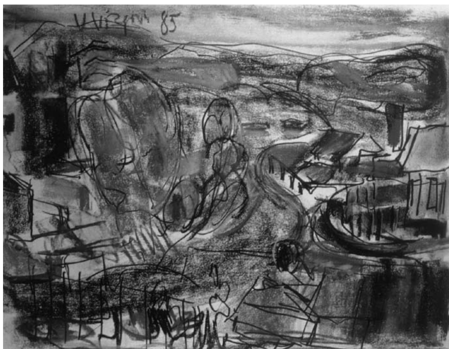
Viktoras VIZGIRDA. Pastelė . 1985