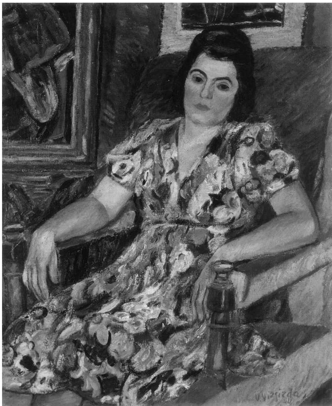
Viktoras VIZGIRDA. Ponios E. Senkuvienės portretas . 1944. Drobė, aliejus. 100 × 81