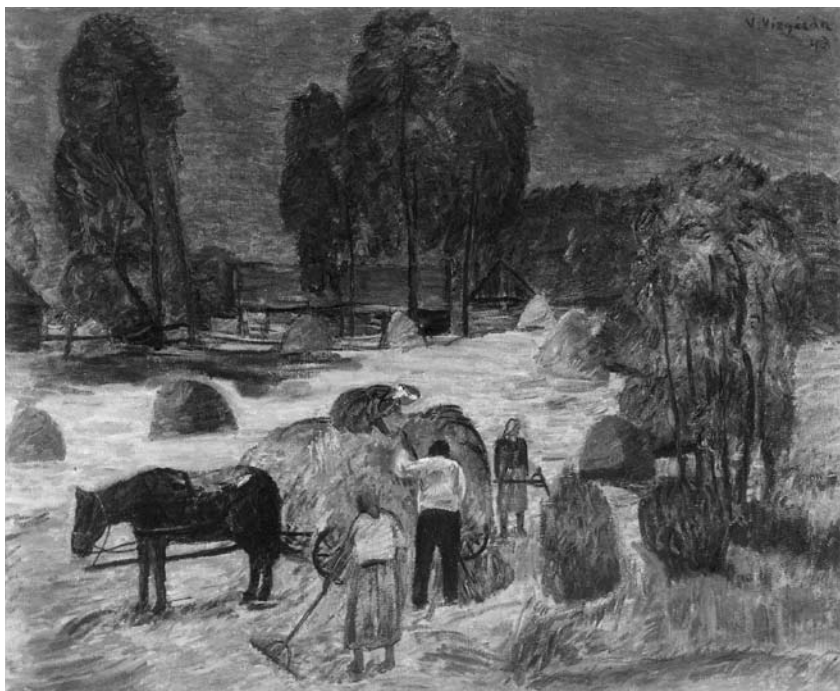
Viktoras VIZGIRDA. Šienapjūtē Višakio Rūdoje . 1943. Drobē, aliejus. 130 × 161