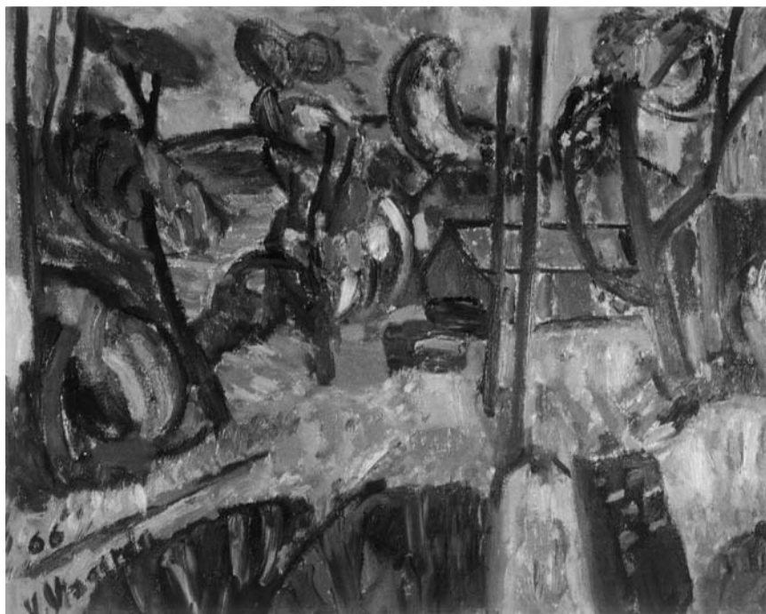
Viktoras VIZGIRDA. Peizažas . 1966. Drobė, aliejus. 60,9 × 76,2