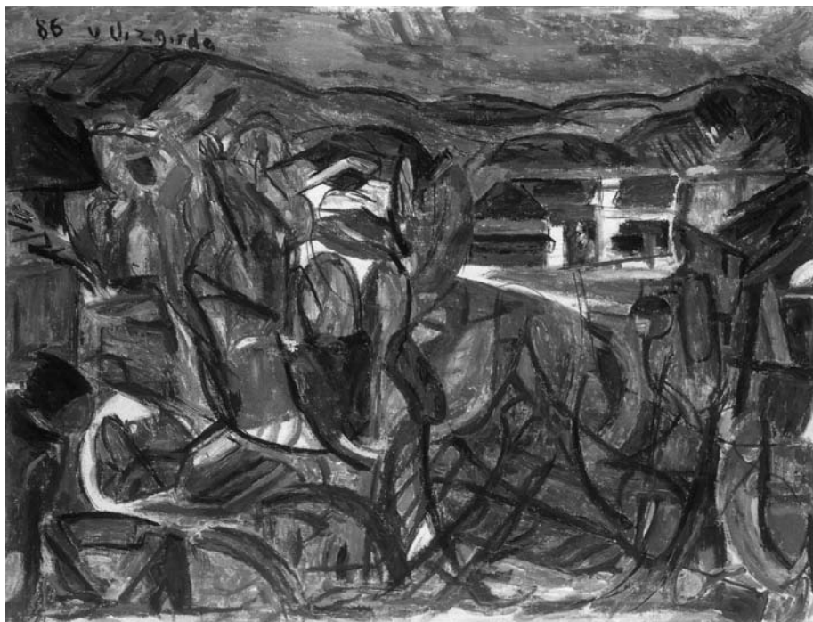
Viktoras VIZGIRDA. Los Angeles apylinkės . 1986. Drobė, akrilas. 91,4 × 121,9