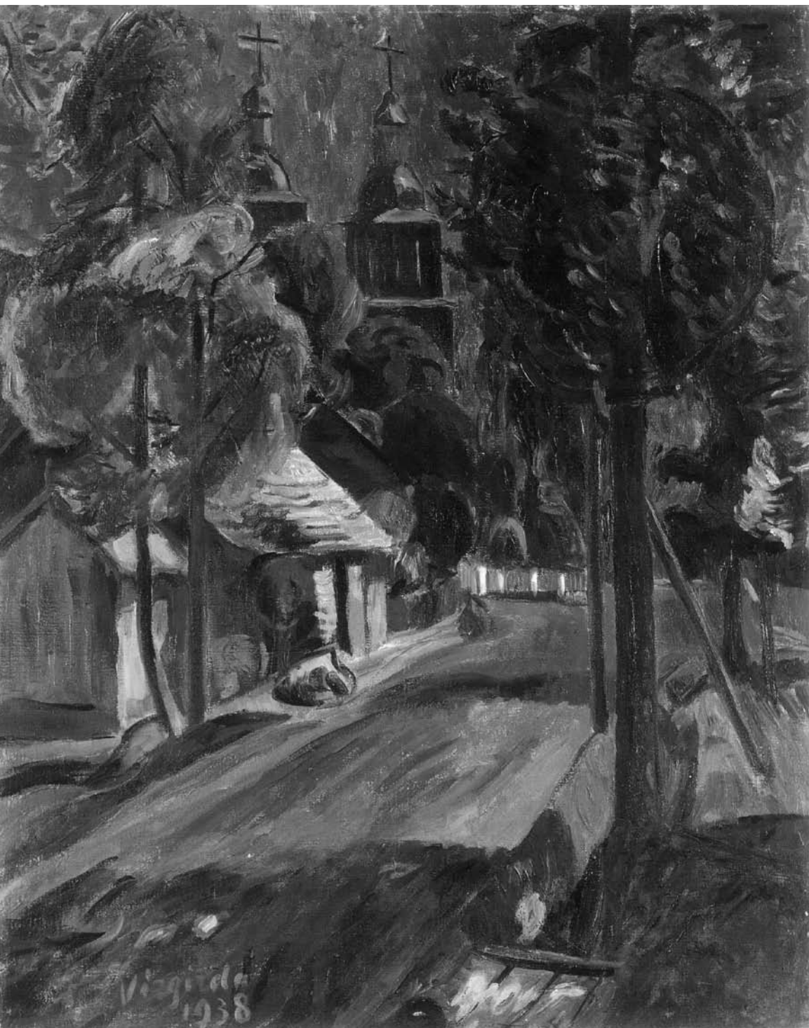
Viktoras VIZGIRDA. Višakio Rūdos bažnyčia . 1938. Drobė, aliejus. 92 × 73