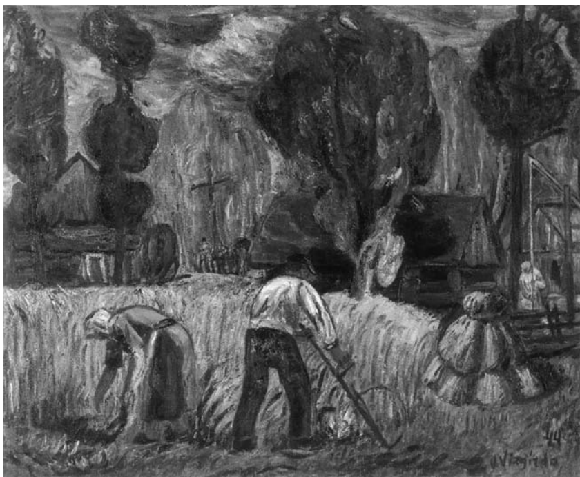
Viktoras VIZGIRDA. Rugiapjūtē . 1944. Drobē, aliejus. 110 × 138