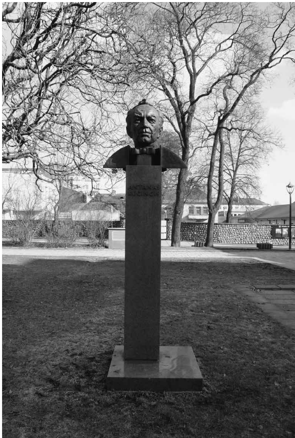
Stasys Žirgulis. Antano Kučingio biustas , 1999