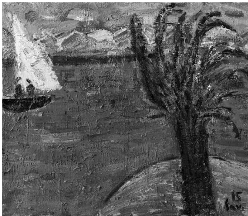
Raimondas SAVICKAS. Poilsis Eilate , 2015. Drobė, aliejus, 69 × 80