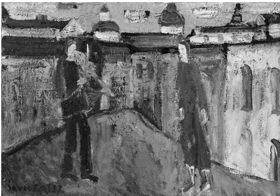
Raimondas SAVICKAS. Senamiesčio melodija , 2012. Drobė, aliejus, 70 × 100