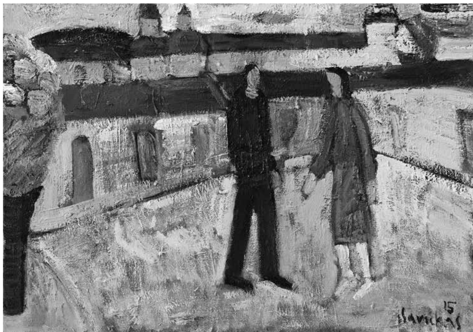
Raimondas SAVICKAS. Psimatymas , 2015. Drobė, aliejus, 70 × 100