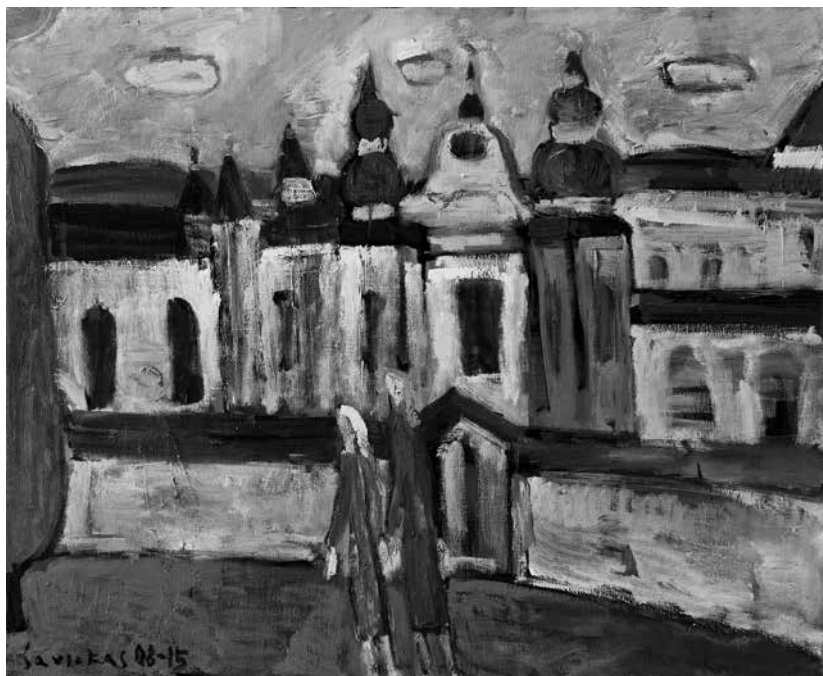
Raimondas SAVICKAS. Gotika, barokas... , 2008–2015. Drobė, aliejus, 90 × 110