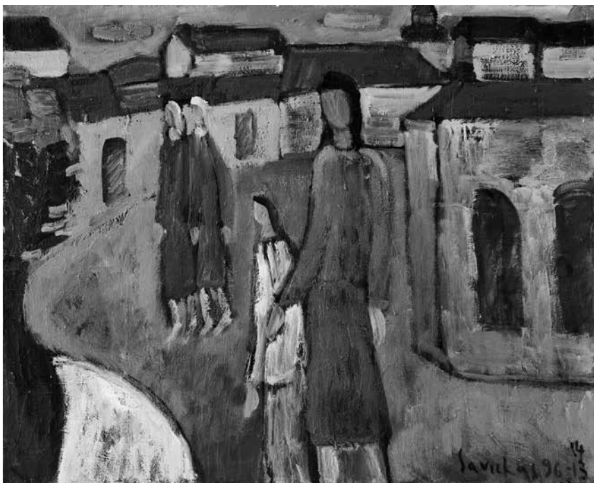
Raimondas SAVICKAS. Žmonės mieste , 1996–2013–2014. Drobė, aliejus, 85 × 105