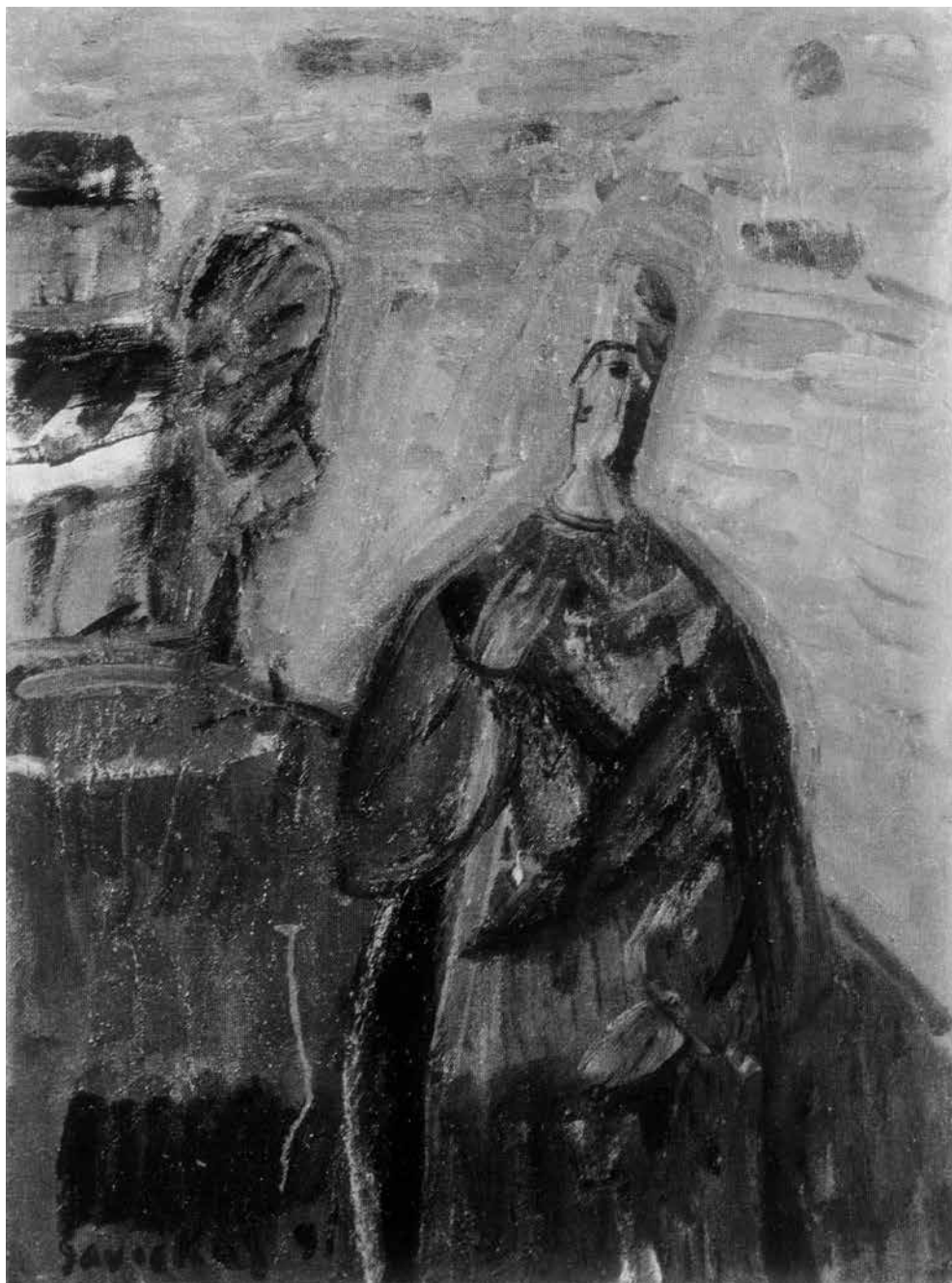
Raimondas SAVICKAS. Prisiminimai , 1991