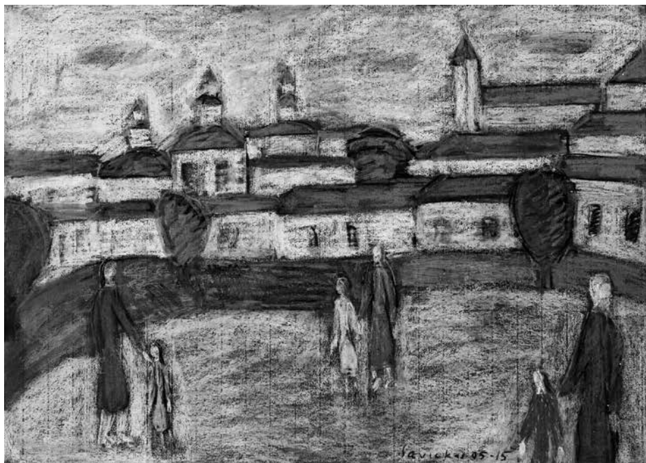
Raimondas SAVICKAS. Panoraminiai vaizdai , 2005–2015. Popierius, pastelė, 50 × 70