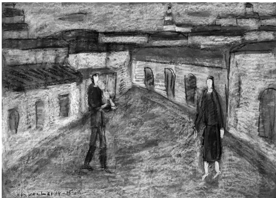
Raimondas SAVICKAS. Melodija , 2014–2015. Popierius, pastelė, 50 × 70