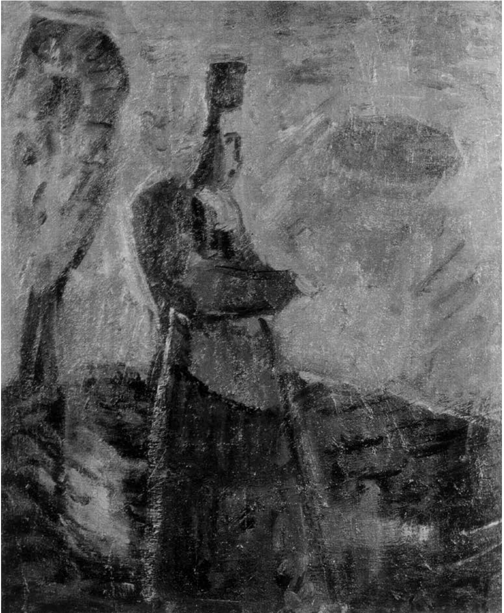
Raimondas SAVICKAS. Karalius , 1991