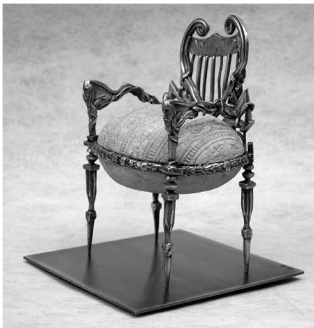
Rūta NIČAJIENĒ. Sostas . 2007. Sidabras, akmuo, sidabro plokštelē. H = 240 mm Atlikta UAB „Metalo forma“