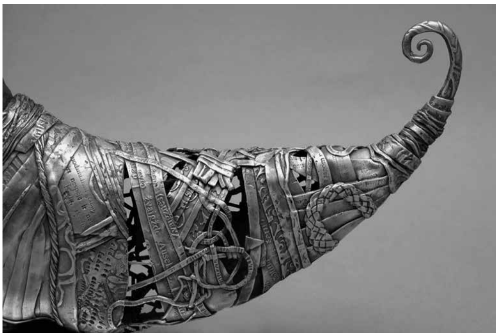
Rūta NIČAJIENĒ. Skorpionas / Gausybės ragas . Detalė. Atlikta UAB „Metalo forma“