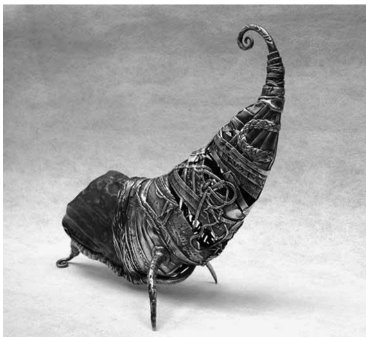
Rūta NIČAJIENĒ. Skorpionas / Gausybės ragas . 2006. Sidabras, gintaras. H = 225 mm. Atlikta UAB „Metalo forma“