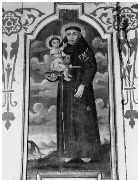
Šv. Antanas stebukladarys

Antano išsimokslinimas ir įstabi iškalbos dovana buvo atskleisti visiškai atsitiktinai, kai jis kartu su broliais atvyko į šventimų iškilmes Frolyje. Taip nutiko, kad Antanui teko sakyti pamokslą. Provincijolas liepė Antanui pamokslauti, ką tik Šventoji Dvasia jam įkvėps. Būtent tuomet jis sužavėjo auditoriją savo iškalba, teologijos ir Biblijos išmanymu bei asmeniniu žavesiu 20 . Nuo to laiko Antanui buvo lemta keliauti pamokslaujant po Italiją ir Prancūziją. Jo misijos anuo metu buvo būtinos Bažnyčiai: jis kvietė žmones atsiversti, pabrėžė Švč. Sakramento ir išpažinties svarbą. Šventųjų antologijoje The Saints teigiama, kad „Bažnyčios nebegalėjo sutalpinti žmonių, norinčių jo pasiklausyti“, tad galų gale visi persikeldavo už miesto, kur susirinkdavo 20 000–40 000 klausytojų 21 . Taigi Antano populiarumas buvo fenomenalus. Jis tapo vyriausiuoju ordino pamokslininku. Kita vertus, šis įstabus vie-