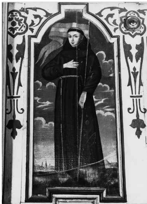
Šv. Jonas Kapestranas