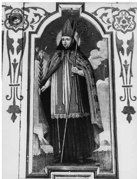
Šv. Liudvikas vyskupas

Pranciškonas šv. Liudvikas Tulūzietis buvo kilęs iš karališkosios Anžu dinastijos, tačiau įpėdinystę iškeitė į skaistu-